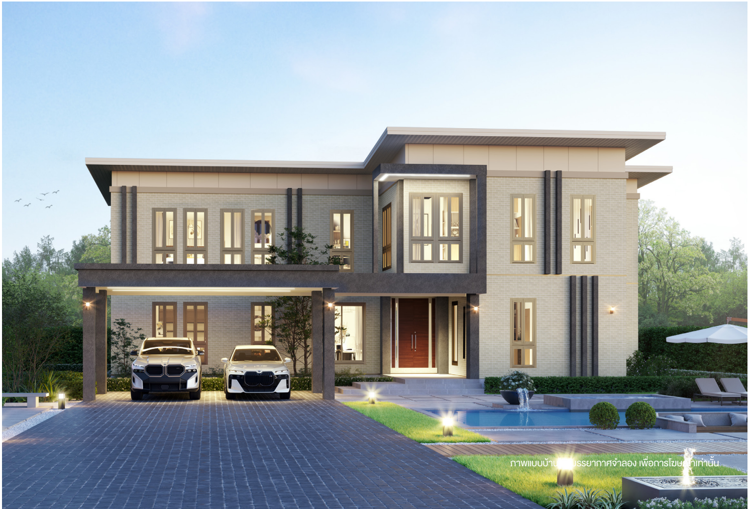
ภาพแบบบ้านที่บรรยากาศจำลอง เพื่อการโฆษณาเท่านั้น

บ้าน 2 ชั้น สไตล์ MODERN STYLE มีความเรียบหรูทันสมัย เลือกใช้วัสดุที่เข้ากันแนวตั้งในการตกแต่ง ให้ความรู้สึกสงบ เรียบง่าย สะท้อนตัวตนของผู้อยู่อาศัย โดดเด่นด้วย Double volume ขนาดใหญ่ จัดวางพื้นที่ส่วนกลางชั้นล่างแบบ Open plan ทำให้บ้านดูโปร่ง โล่ง สบาย และเชื่อมต่อกันอย่างไม่มีขอบเขต เพื่อรองรับการทำกิจกรรมในครอบครัว พิเศษห้องนอนชั้นล่างขนาดใหญ่พร้อม Walk in closet รองรับการใช้งานของผู้สูงวัย