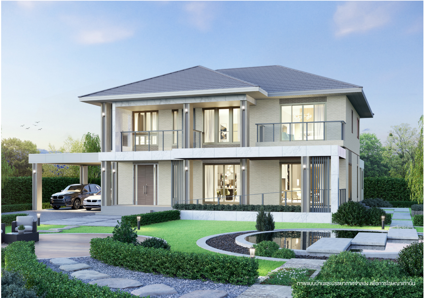
ภาพแบบบ้านและบรรยากาศจำลอง เพื่อการโฆษณาเท่านั้น

บ้าน 2 ชั้น สไตล์ MODERN STYLE โดดเด่นด้วยการผสมผสานความร่วมมือและความโมเดิร์นเข้าด้วยกัน เลือกใช้กระเบื้องสายหินอ่อนตกแต่งร่วมกับ Façade ระเบียงอลูมิเนียมแนวตั้ง ดูสง่างาม มีระดับมากยิ่งขึ้น พื้นที่ภายในบ้านจัดวางพื้นที่ใช้สอยเป็นสัดส่วน โถงสูงในบ้านขนาด 6 เมตร ช่วยให้ดูโปร่ง โล่งสบายยิ่งขึ้น เพิ่มความเป็นส่วนตัวยิ่งขึ้นด้วย Family room ชั้น 2 พร้อมทางลาดรถเข็นหน้าบ้าน เพื่อรองรับการใช้งานของผู้สูงอายุ