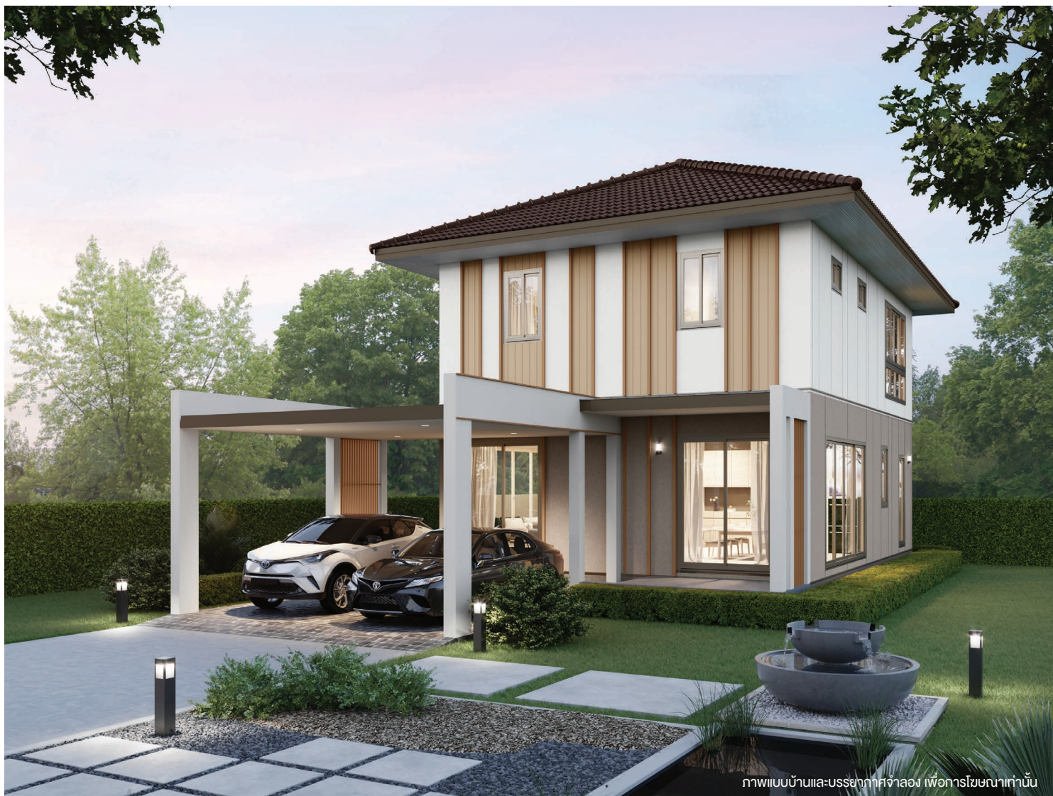
ภาพแบบบ้านและบรรยากาศจำลอง เพื่อการโฆษณาเท่านั้น

บ้านสองชั้นสไตล์ nature ให้ความรู้สึกอบอุ่นกับผู้อยู่อาศัย ออกแบบมาเพื่อที่ดินหน้าแคบ ฟังก์ชันภายในรองรับและครอบคลุมทุกการใช้งาน โปร่งโล่งสบายด้วยหน้าต่างบานใหญ่ เหมาะกับครอบครัวที่ต้องการเริ่มต้นชีวิตใหม่ในพื้นที่จำกัด