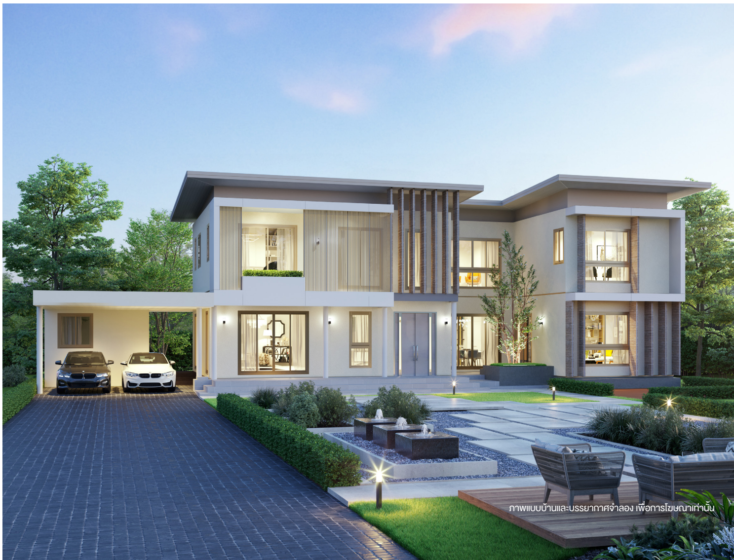
ภาพแบบบ้านและบรรยากาศจำลอง เพื่อการโฆษณาเท่านั้น

บ้าน 2 ชั้น สไตล์ MODERN สำหรับครอบครัวขนาดกลาง โดดเด่นด้วยการออกแบบบ้านให้เรียบหรู กั้นสมัย ด้วยโทนสี ivory และระแนง Façade อลูมิเนียมแนวตั้งสีทองแซมเปอญ พื้นที่ส่วนกลางในบ้านชั้น 1 ห้องนั่งเล่นภายในบ้านมีขนาดใหญ่เชื่อมต่อกับพื้นที่ Semi-outdoor เปิดมุมมองรับสวนสวย และรองรับกิจกรรมต่างๆ ร่วมกันภายในครอบครัว พื้นที่ภายในชั้น 2 เพิ่มความพิเศษด้วยห้องนอนใหญ่มีระเบียงเชื่อมต่อกับ Family room ชั้น 2 ขยายพื้นที่ความสุข มุมพักผ่อนส่วนตัว และสะดวกสบายยิ่งขึ้น